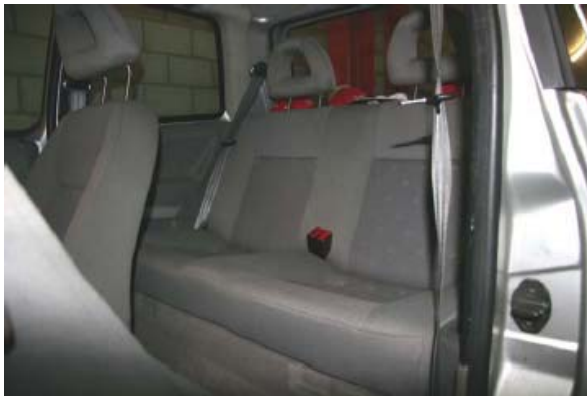
Abbildung 3: Geschlossene Rückbank ohne CR