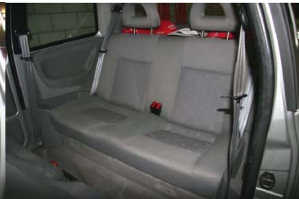
Abbildung 4: Geschlossene Rückbank mit CR

Der Batterypack, bei diesem VW Lupo Model, war unter der Rückbank nicht bemerkbar.