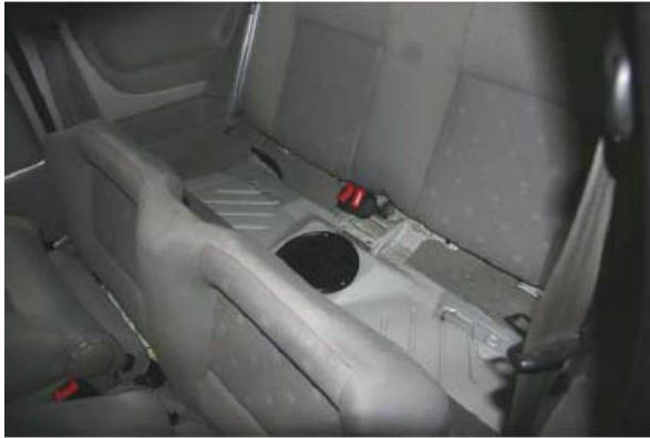
Abbildung 1: Geöffnete Rückbank

Crash Recorder und Batterypack kann unter der Rückbank eingebaut werden. Die Rückbank ist klappbar. Je nach Einbaulage muss der Crash Recorder mit einem zusätzlichen Klebestreifen nivelliert werden.