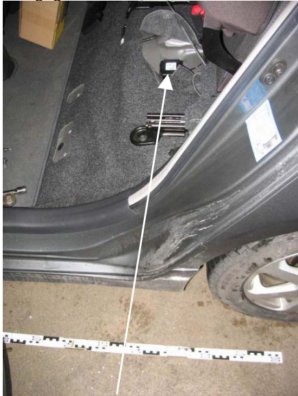
Abbildung 1: Crash Recorder

Crash Recorder, links oder rechts zur Fahrzeugmitte gerichtet, unter der Rücksitzbank montieren. Nivellieren nicht vergessen. Batterypack unter der Rücksitzbank befestigen/kleben (ausreichend Klebeband verwenden) und gegen losreißen sichern.