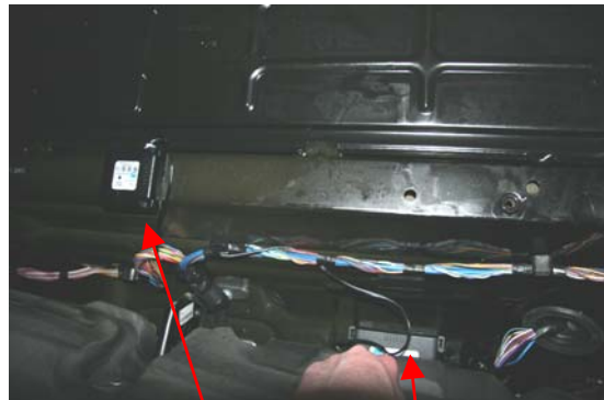
Abbildung 3: Crash Recorder und Batterypack unter Fahrersitz