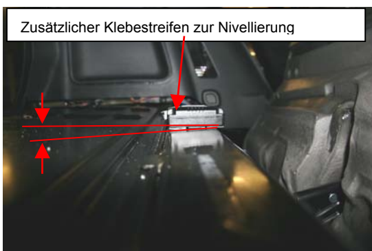
Abbildung 3: Crash Recorder, nivelliert