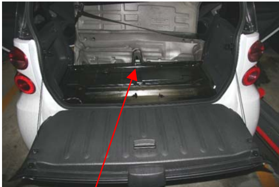
Abbildung 1: Crash Recorder

Crash Recorder, zur Fahrzeugmitte gerichtet und vor der Motorabdeckung montieren. Nivellieren nicht vergessen. Batterypack unter Fahrer-/Beifahrersitz (ausreichend Klebeband verwenden) und gegen losreißen sichern.