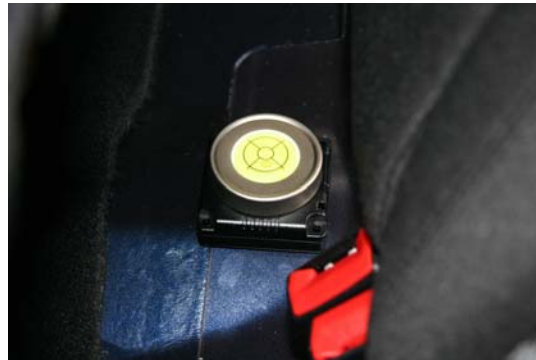
Abbildung 2: Crash Recorder, nivelliert