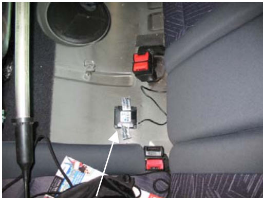
Abbildung 1: Crash Recorder

Crash Recorder, mittig und zur Fahrzeugmitte gerichtet, unter der Rücksitzbank montieren. Nivellieren nicht vergessen. Batterypack unter der Rücksitzbank befestigen/kleben (ausreichend Klebeband verwenden) und gegen losreißen sichern.