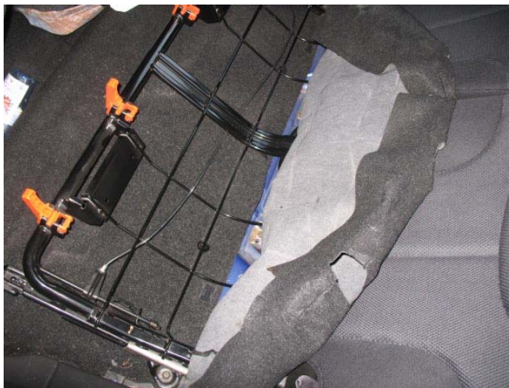
Abbildung 1: Crash Recorder und Batterypack verdeckt

Crash Recorder, zur Fahrzeugmitte gerichtet, unter der Rücksitzbank montieren. Nivellieren nicht vergessen. Batterypack unter der Rücksitzbank befestigen/kleben (ausreichend Klebeband verwenden) und gegen losreißen sichern.